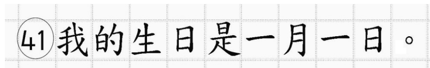
Рис.14. Образец написания иероглифических знаков

иероглифический знак и каждый знак препинания следует писать внутри отдельной клетки области ответов бланка ответов № 2 (дополнительного бланка ответов № 2) (рис. 14).