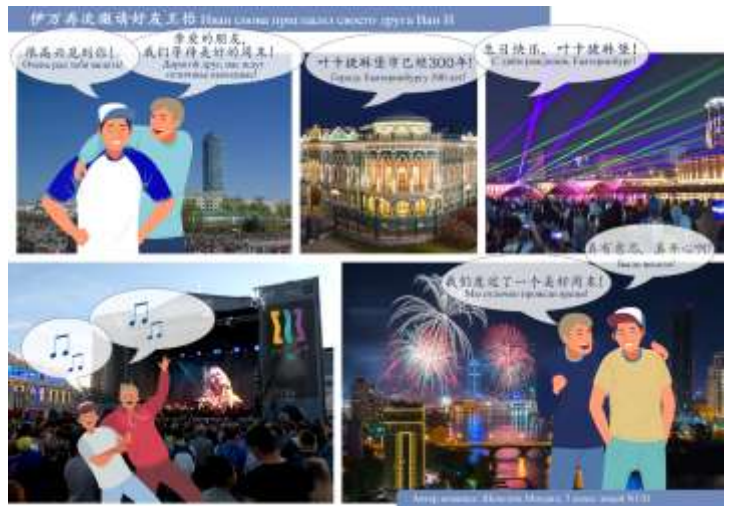
автор Дворникова Николь, гимназия 99