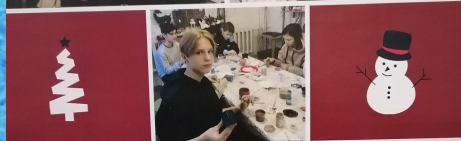
ПОЗДРАВЛЯЕМ С ПРАЗДНИКАМИ! ПРОЕКТ "ЗИМНЯЯ СКАЗКА" УЧЕНИКОВ 7Г И 3Г КЛАССОВ